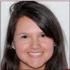
COLOMBIE / COLOMBIA

Au sein de la Direction Stratégie, Recherche et Innovation du Groupe Renault et en partenariat avec la Direction Innovation du Groupe Keolis, cette étude porte sur les enjeux du déploiement de solutions de mobilité zéro émission dans le contexte du projet franco-chinois d'éco-cité à Caidian en Chine. Elle vise à analyser l'opportunité de s'appuyer sur un projet d'éco-cité pour développer des solutions innovantes et les mettre en œuvre dans le cadre d'un schéma de mobilité plus global, en intermodalité avec les solutions classiques de transport public, et en conformité avec le schéma d'aménagement urbain.