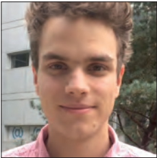
FRANCE & ALLEMAGNE FRANCE & GERMANY

La maîtrise des coûts dans la supply chain est un critère fondamental de compétitivité dans l'automobile. Au-delà de cet aspect, Renault y exige aussi une hausse de la performance environnementale.