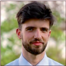
GRANDE-BRETAGNE GREAT BRITAIN

Clem' (anciennement MOPeasy) est un opérateur français de services de mobilité, notamment l'autopartage de véhicules électriques, le covoiturage et la réservation des bornes de recharge.