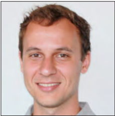
BRÉSIL / BRAZIL

Egis est un groupe international d'ingénierie, de montage de projets et d'exploitation. Il intervient dans les domaines des transports, de la ville, du bâtiment, de l'industrie, de l'eau, de l'environnement, de l'énergie, des autoroutes et des aéroports. Une des branches du groupe, Egis Rail est spécialisée dans les projets ferroviaires (aménagement des lignes classiques et à grande vitesse) et dans des projets de TCSP (métro, tramway, transport par câble) et intervient sur tous les continents.