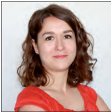
FRANCE / FRANCE

Les transports constituent l'un des leviers indispensables permettant de tendre vers une démarche de durabilité dans ce contexte de changement climatique. La création d'infrastructures ferroviaires constitue une première démarche de développement durable, permettant de répondre aux besoins croissants de mobilité et de constituer une alternative à la voiture individuelle.