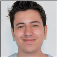
ALGÉRIE / ALGERIA

La direction Connaissance clients du groupe Renault effectue des études de marché dans plusieurs pays cibles. Le service Market intelligence à travers sa division en Chine s'intéresse à comprendre les tendances, les comportements et les usages des clients chinois.