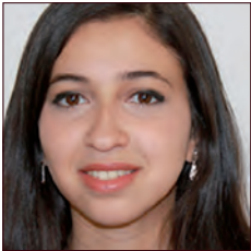
ALGÉRIE / ALGERIA

Aujourd'hui, les ONG prennent de plus en plus de place dans le dialogue des parties prenantes, notamment sur les réglementations mises en œuvre par les Etats et les politiques environnementales des entreprises.