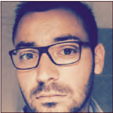
FRANCE / FRANCE

Les Transports en Commun de la Région d'Avignon, également connus sous l'acronyme TCRA représentent le réseau de transports en communs de l'agglomération d'Avignon.