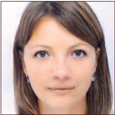
RUSSIE / RUSSIA

Société anonyme d'économie mixte, la Compagnie des Transports Strasbourgeois (CTS) est liée avec son actionnaire principal l'Euro-métropole (EMS) par contrat de concession depuis 1990 jusqu'en 2020. À la perspective de la fin de ce contrat, avec le choix éventuel d'un nouvel exploitant du réseau, la CTS a lancé des plans d'amélioration pour la période 2014 – 2018, son objectif est de devenir plus performante et être ainsi le meilleur candidat pour l'EMS.