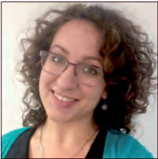
RUSSIE / RUSSIA

Dans le contexte des politiques publiques mises en place par les gouvernements, nationaux ou locaux, pour limiter les impacts environnementaux et de santé publique du transport et réduire la congestion dans les villes, les restrictions à l'accès et à la circulation automobile dans les zones urbaines deviennent un des moteurs dominants d'évolution des marchés.