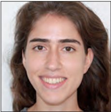
TURQUIE / TURKEY

Pour atteindre les objectifs dévoilés dans son nouveau plan stratégique « Drive the Change », le Groupe Renault s'appuie sur 7 leviers et plus précisément, pour ce qui nous intéresse, sur la réduction des coûts et l'optimisation de ses capacités industrielles.