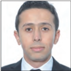
MAROC / MOROCCO

La conjoncture économique actuelle pousse les entreprises à maîtriser leurs postes de dépenses et optimiser les coûts qui en découlent. La mobilité des salariés et, en l'occurrence la gestion de flotte de véhicules des entreprises participe également de cette logique.