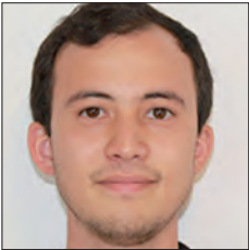
BRÉSIL / BRAZIL

Au sein de l'Alliance Renault Nissan des plans de convergence ambitieux dans un certain nombre de métiers clés, dont celui de la Supply Chain, ont été mis en place avec l'objectif de développer des synergies et dégager des économies. Inscrite dans cette stratégie, la fonction de la Logistique Amont (Direction Inbound, Packaging & Projects), qui intègre le périmètre des AILN (Alliance International Logistics Network), anime l'ensemble des opérations logistiques liées au transport et à l'approvisionnement de pièces depuis les sites fournisseurs overseas jusqu'aux usines utilisatrices. Elle concerne, entre autres, le transport des marchandises et des emballages retournables, le stockage, l'animation des projets et la gestion des AILN.