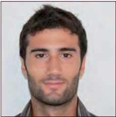
LIBAN / LEBANON

Dans l'optique d'un allègement des futurs véhicules Renault, de nouveaux matériaux composites innovants seront envisagés. Mais il se pourrait que la phase de production de ces matériaux handicape le gain environnemental généré dans la phase d'usage. On propose d'établir l'analyse de cycle de vie de ces nouveaux matériaux pour conforter ce choix technique par une justification environnementale réelle.