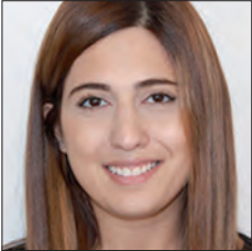
LIBAN / LEBANON

Les flux logistiques inbound de Renault-Nissan en Europe sont essentiellement réalisés par camion. La part du multimodal est faible (aux environs de 24% au global). Ceci est dû à plusieurs raisons, notamment i) la flexibilité du transport par camions, par opposition aux contraintes liées au mode ferroviaire (horaires fixes, réservation des sillons, transbordements difficiles en cas d'aléas) ; ii) l'importance des lead-time et donc de l'impact en termes de stocks en usine et, enfin, iii) la compétitivité du camion par rapport au train sur certains axes, compétitivité liée notamment au faible prix du pétrole ces dernières années. Renault-Nissan a donc réussi à obtenir des offres très intéressantes de la part de ses prestataires de transport routier et a réduit significativement ses coûts.