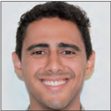
BRÉSIL / BRAZIL

La mission globale du Supply Chain Management (SCM) de l'Alliance Renault-Nissan consiste à influencer ses Directions Partenaires afin de diffuser les logiques qui sont les siennes auprès de ces dernières.