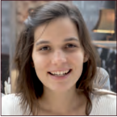
BRÉSIL / BRAZIL

Robert Bosch GmbH est une entreprise globale présente dans 150 pays et est un équipementier automobile leader dans le monde. Le secteur de solutions de mobilité a généré 59% des revenus en 2015 avec un taux de croissance de 12% par rapport à l'année précédente.