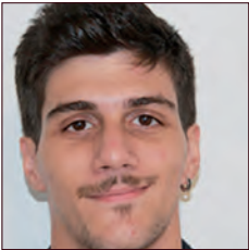
ALGÉRIE / ALGERIA