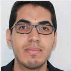
MAROC / MOROCCO

En support au plan RENAULT ECO 2 , le groupe Renault a signé le 28 octobre 2015 la charte Fret 21. Cette initiative créée dans l'esprit de la COP 21 par l'agence de l'environnement et de la maîtrise de l'énergie (ADEME) avec l'association des utilisateurs de transport de Fret (AUTF) a pour objectif d'encourager les chargeurs à s'engager sur un objectif volontaire de réduction de leurs émissions CO 2 .