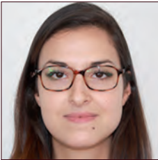
ALGÉRIE / ALGERIA

Dans une optique d'amélioration continue et dans le but de répondre au mieux aux besoins des clients d'aujourd'hui et de demain, Renault conduit chaque année des centaines de projets d'innovation au cours desquels les technologies qui équiperont les futurs véhicules sont développées. Chacune de ces technologies représente un engagement matière à moyen ou long terme. C'est pourquoi, il est essentiel d'intégrer une analyse prospective quant au coût et à la disponibilité de la matière engagée au processus d'innovation actuel afin d'anticiper les risques liés à celle-ci.