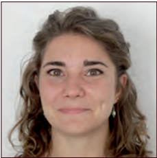
FRANCE / FRANCE

L'innovation collaborative est une méthode de génération d'idées et de projets de plus en plus utilisée en entreprise. Transdev a conçu ses propres programmes d'innovation collaborative pour répondre à la forte compétition internationale pour les appels d'offres en transports publics.